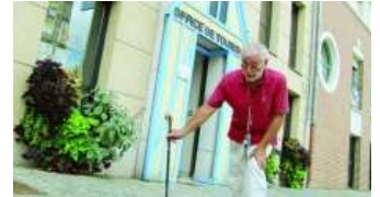
Agrandir la photo

Incognito, le président de l'association Mobilité réduite a parcouru les rues de Nogent et visité les lieux publics. Le verdict est mitigé