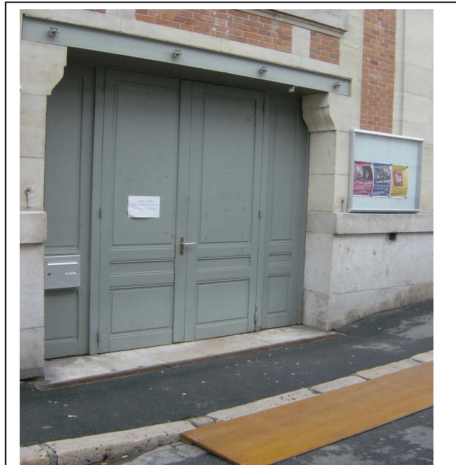
Rue Richelieu : Porte "anonyme" d'accès au bureau de vote des PMR