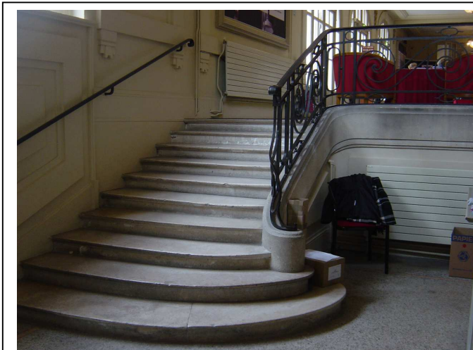
10 marches pour accéder au bureau de vote, pas de fléchage du cheminement à suivre pour trouver un éventuel ascenseur...