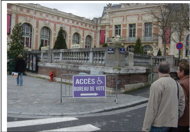
Rue Denecourt : seul panneau indiquant l'accès pour PMR