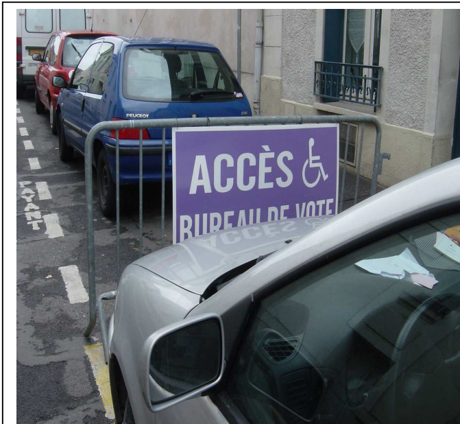
Rue Richelieu : Panneau indiquant l'accès des PMR au bureau de vote caché par véhicule en stationnement (donc invisible)