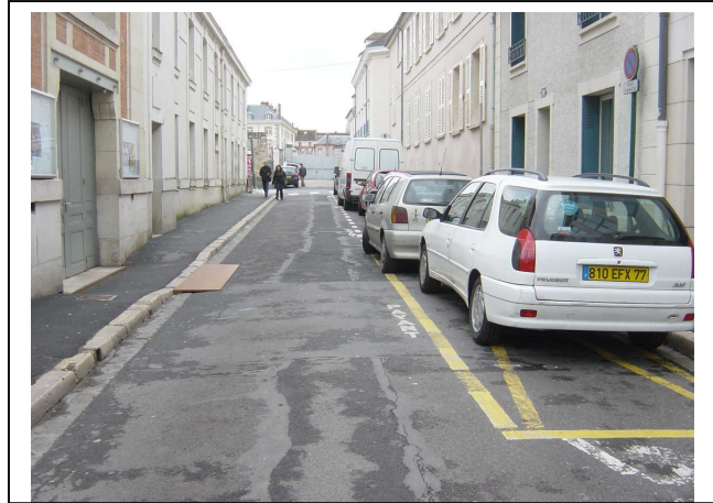
Rue Richelieu : pas de stationnement réservé aux PMR